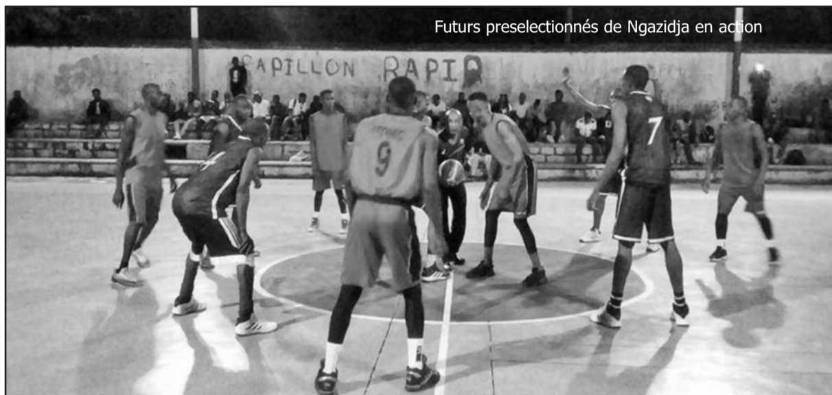
Futurs preselectionnés de Ngazidja en action